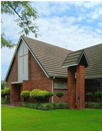
Vryheid (Natal) – Kirche und Pfarrhaus – ehemaliger „Arbeitsplatz“