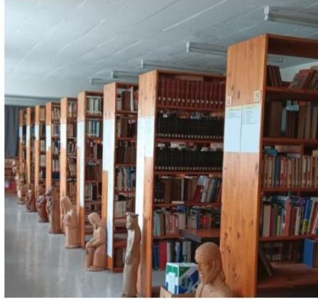
Klosterbibliothek in Vryheid, in der Pfr. Haessig einmal wöchentl. geforscht hat