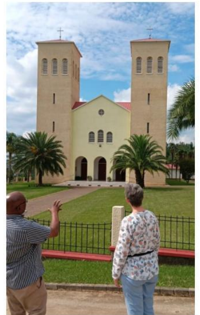
Benediktiner Kloster (Vryheid)