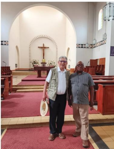
Benediktiner Kloster Inkamana (mit Mönch in Zivil)