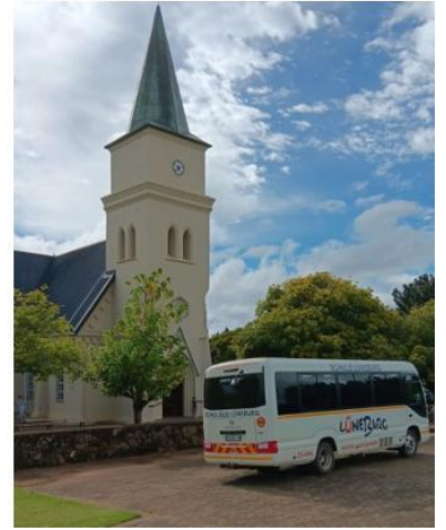
Kirche in Lüneburg (Natal) und eigener Gemeindebus