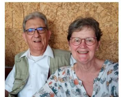
... eine wundervolle Reise geht zu Ende!